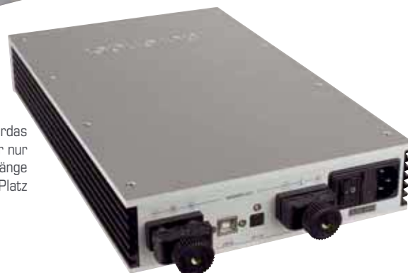
Die Lautsprecherklemmen von Cardas sind äußerst solide, lassen aber nur Gabelschuhe zu. Die beiden Eingänge finden zwischen den Klemmen Platz