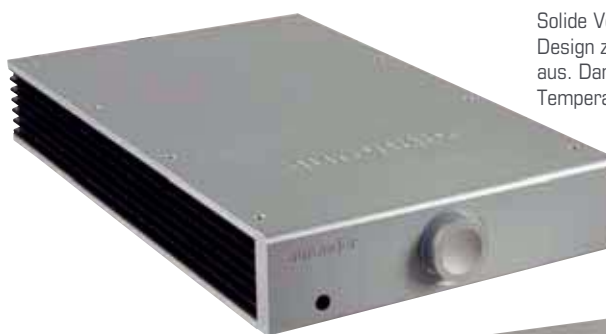
Solide Verarbeitung und minimalistisches Design zeichnen den langgezogenen Verstärker aus. Dank der großen Kühlrippen bleibt die Temperatur recht niedrig

den zurzeit anliegenden Eingang anzeigt. Bei weißer Beleuchtung wird der asynchrone USB-B-Eingang verwendet, erstrahlt der Knauf in grünlichem Licht, ist der optische S/PDIF-Eingang gerade in Betrieb. Weitere Anzeigen, die einem zum Beispiel Auskunft über die momentane Lautstärke oder eine aktivierte Stummschaltung geben, sind nicht vorhanden. Aber auch hier kommt erneut das Argument auf, dass