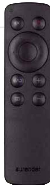
Wer einen Aurender-Server mit dem X725 verwendet hat fast keine Verwendung für die kleine Fernbedienung

Seite stufenweise eingestellt oder das Gerätstumm geschaltet werden. Die gleichen Bedienmöglichkeiten stehen einem auch bei Benutzung der kleinen Fernbedienung zur Verfügung. Sowohl Lautstärke und Stummschaltung funktionieren hier immer, den Eingang wechseln kann man jedoch damit nur, wenn ein Audioserver der Marke Aurender angeschlossen ist. Sollte das nicht der Fall sein, steht man vor einem kleinen Problem, denn Eingabeinstrumente zum Umschalten der Quelle finden sich am Gerät selbst keine. Eine etwas unverständliche Entscheidung, doch da der X725 so stark auf den X100 ausgelegt ist, ist sie zumindest nachvollziehbar, wenn auch nicht ganz praktisch. Die dritte Art, zumindest die Lautstärke zu kontrollieren, ist der große Drehregler in der Mitte der Gerätefront. Ebenfalls aus Aluminium, fühlt sich das Potenziometer gut an und hat einen ausgezeichneten Widerstand, so dass man beim Bedienen ein wunderbar analoges Gefühl hat. In einem kleinen Ring rund um den Regler herum ist ein Beleuchtungskranz eingefasst, dessen Farbe