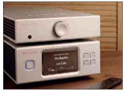
Mit dem X725 erhält der X100 einen guten Partner, der perfekt auf ihn abgestimmt ist

Im Spiel macht sich das recht neutrale Klangbild der kleinen DAC/Verstärkerkombi bemerkbar. Während bei der Verwendung mit dem Aurender W20 je nach Aufnahme einen eher warmen, analogen Sound verbreitete, reichte er die Signale vom