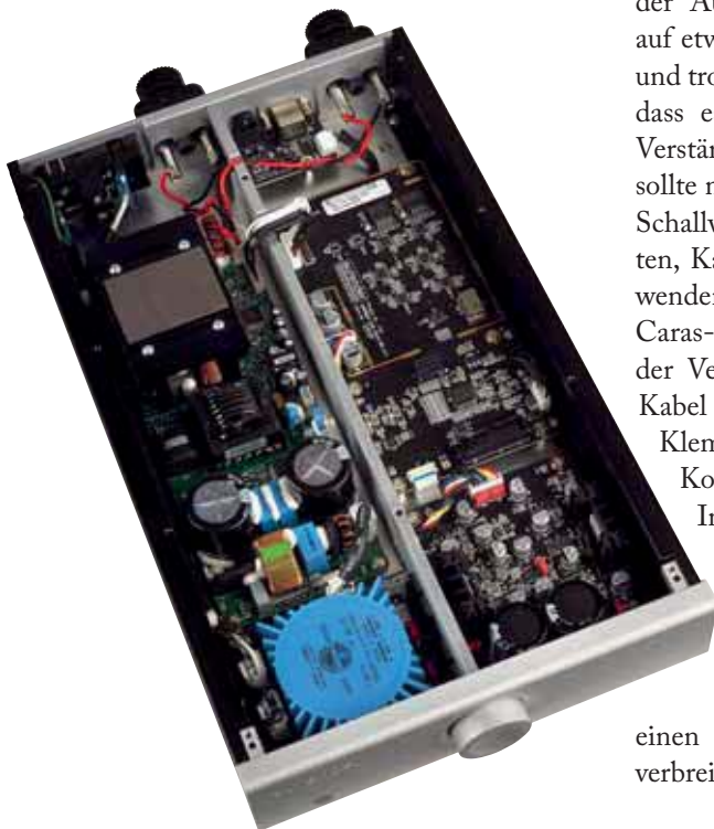
Die linke Gehäusehälfte ist komplett der ICEpower-Endstufe gewidmet, rechts sitzen Vorstufe und DAC-Board