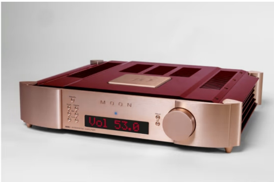
600i V2 Spéciale Edition

Comme de coutume chez le constructeur Canadien, le 600i V2 pourra à la demande être livré en noir, en gris aluminium, ou version bicolore : tableau de commande noir et joues gris aluminium. Sans compter la très rare Spéciale Edition.